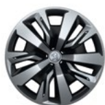
Ratkapna 16" NOLITA