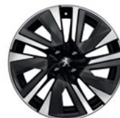
Aluminijumska felna 18" BUND dvobojna sa dijamantskim efektom