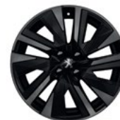
Aluminijumska felna 18" EVISSA dvobojna sa dijamantskim efektom