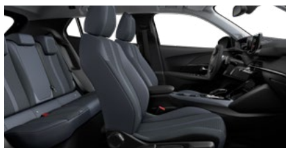
Tkanina Cozy & TEP Isabella