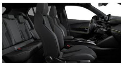
Mistal crna Alcantara & TEP Isabella