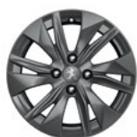
Aluminijumska felna 16" ELBORN