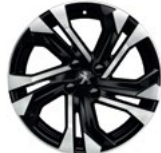
Aluminijumska felna 17" SALAMANCA dvobojna sa dijamantskim efektom