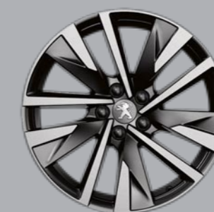
18" SPERONE dvobojne sa dijamantskim efektom