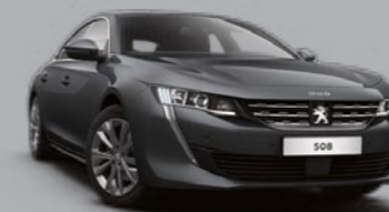
Siva Hurricane (1)