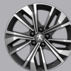
17" MERION dvobojne sa dijamantskim efektom