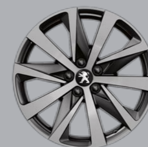
18" HIRONE dvobojne sa dijamantskim efektom i sa Grey Dust lakom