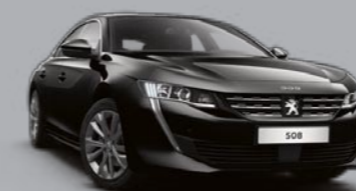
Crna Perla Nera