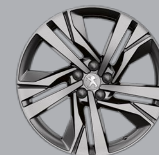
19" AUGUSTA dvobojne sa dijamantskim efektom