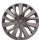
Ratkapna TONGARIRO 16"