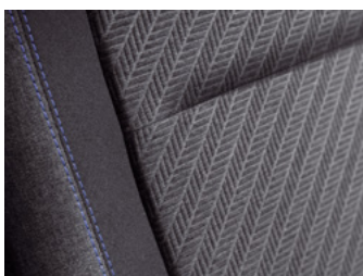
Tamna unutrašnjost od "Puma" tkanine