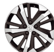
Aluminijumska felna 17" AORAKI