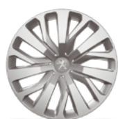
Ratkapna RAKIURA 16"