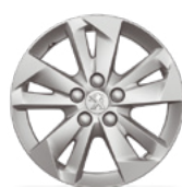
Aluminijumska felna 16" TARANAKI