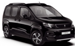
Crna Perla Nera