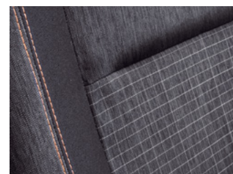
Tamna unutrašnjost od "Casual" tkanine